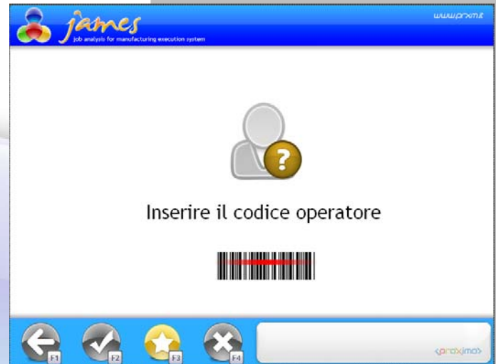
Inserimento del codice operatore

james è già una realtà per i rivenditori Microarea® che necessitano di un sistema di raccolta dati per la gestione del manufacturing su Mago.Net. Il driver realizzato in TaskBuilder.Net® permette di automatizzare il processo di consuntivazione degli avanzamenti di produzione e rende disponibili le informazioni acquisite in produzione a tutti gli utenti gestionali.