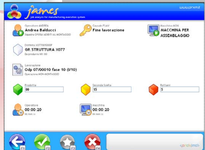
Consuntivazione della fase